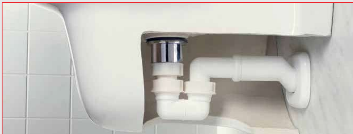
Sifone eccentrico installato su un bidet