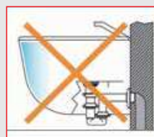
Esempio di installazione non corretta