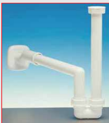
Sifone eccentrico per lavabo e bidet

Il Sifone eccentrico, come tutti i prodotti Lira è realizzato nello stabilimento di Valduggia sede dell'azienda