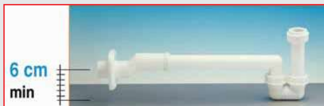
il sifone è adattabile in altezza partendo da un minimo di 6 cm